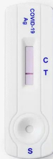
Foto: Testitulemuse hindamine töötajate testimiseks mõeldud Siemens Clintest testiga.

If there is no line visible, or only one line at "T," the result is invalid